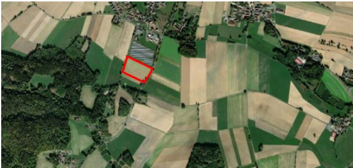
Abb. 1: Lage des Solarparks im Luftbild.

Der Vorhabenstandort für den geplanten Solarpark befindet sich am südöstlichen Ortsrand der Marktgemeinde Fuchsmühl und schließt an einen bereits bebauten Solarpark an.