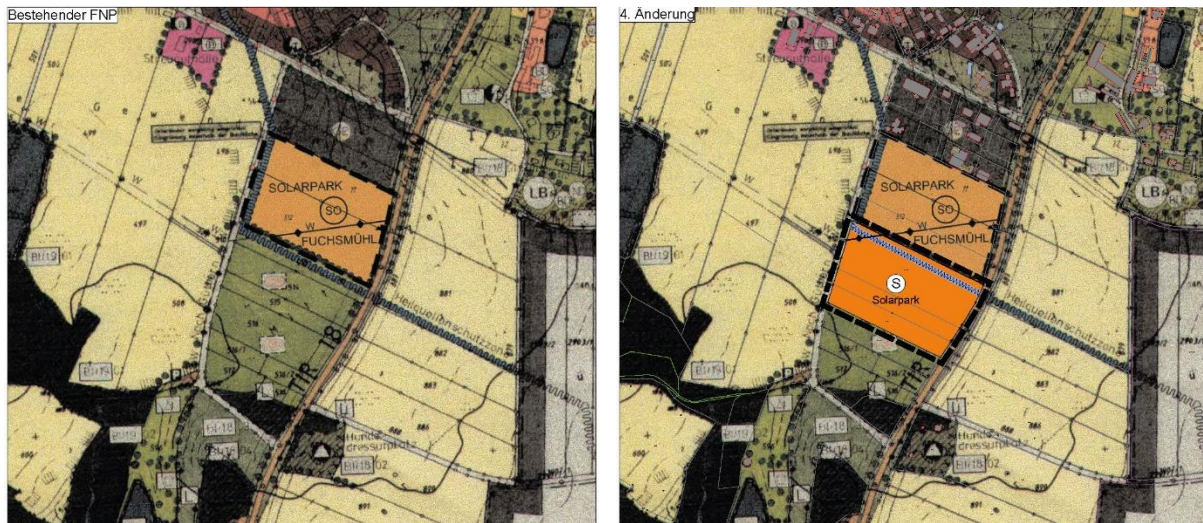
Abb. 5: Vergleich rechtskräftiger FNP und 4. Änderung.

Entsprechend der Flächenausweisungen des vorhabenbezogenen Bebauungsplans „Solarpark Fuchsmühl 2“ sollen die Flächenausweisung in „Sonderbaufläche: Solarpark“ geändert werden.