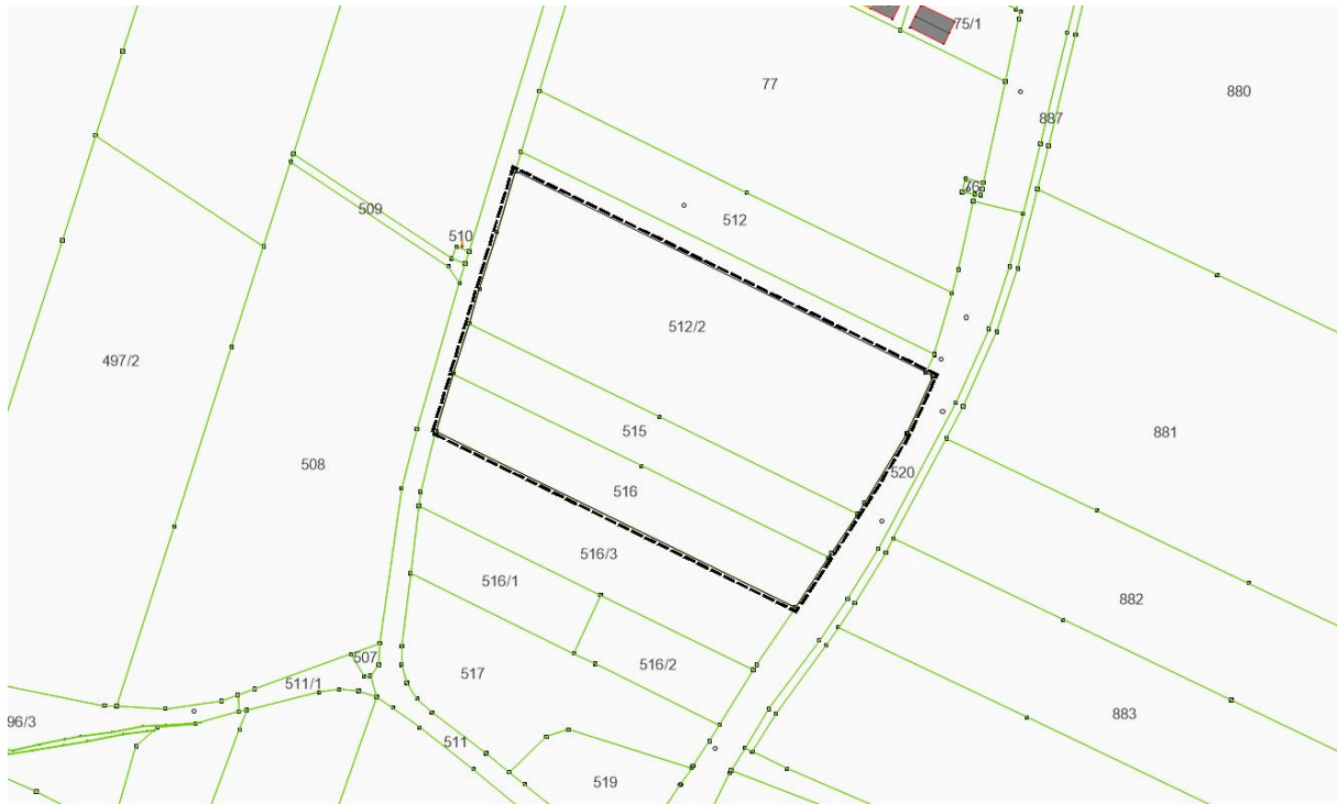
Abb. 2: Geltungsbereich im Katasterauschnitt.