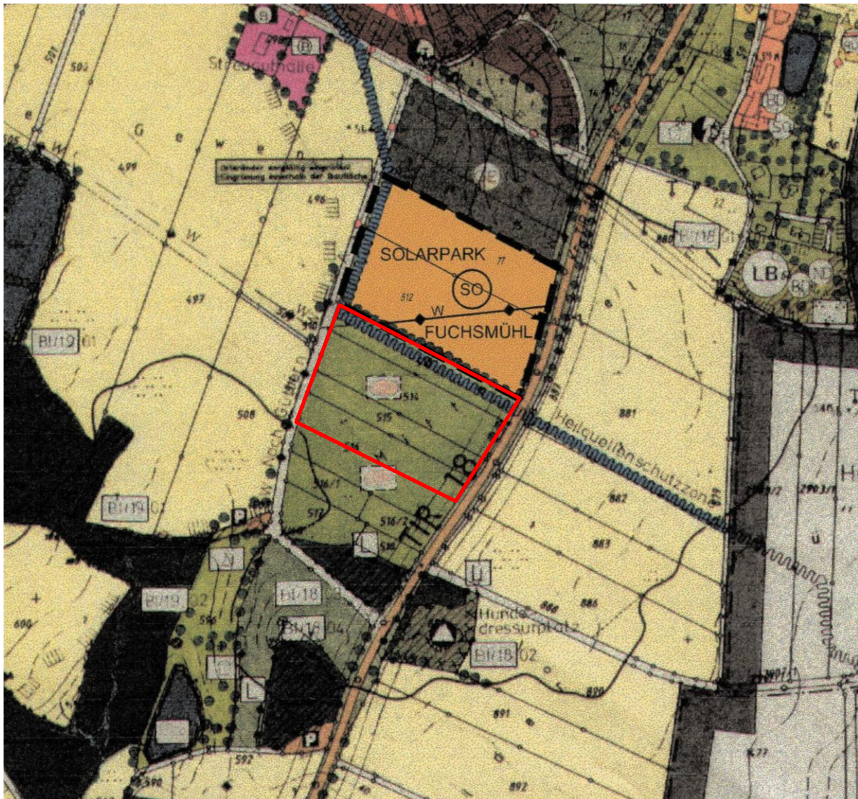
Abb. 4: Ausschnitt aus dem Flächennutzungsplan.

Der geltende Flächennutzungsplan stellt im Geltungsbereich Grünfläche: Sportplatz dar.